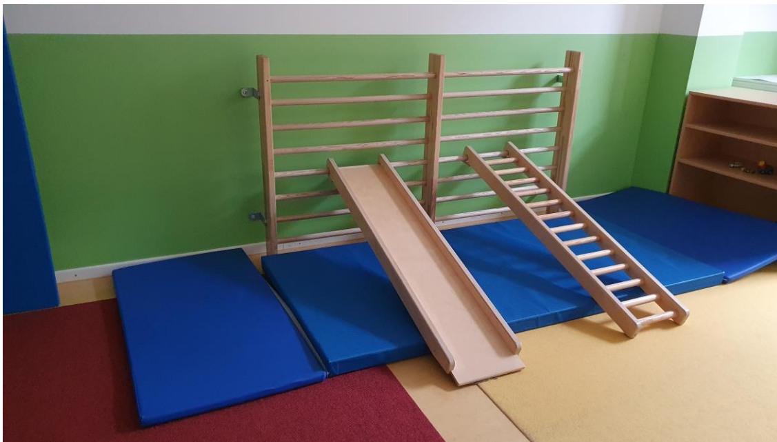
Eine Sprossenwand mit einem Kletter- und Rutschelement

Entlang der Gruppenräume befindet sich unser Garten. Dort lädt ein großer Sandkasten mit einem Wasserspielelement zum Buddeln ein, bietet Platz zum Fahrzeuge fahren, ein Rasenbereich mit einer Wippe und ein Spiel- und Klettergerät, das im Frühjahr 2021 neu errichtet wurde.